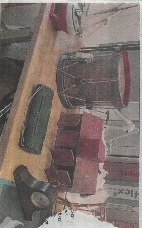
Børnene udviklede genstande til museums-montren - blandt andet en gammel brand-tromme, en lege-tøjs-brandstation og et modelskib.